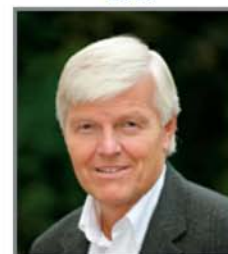
Atle Dyregrov 2011