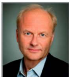
Finn Skårderud 2012