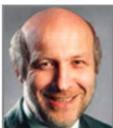
Peter Fonagy 2006