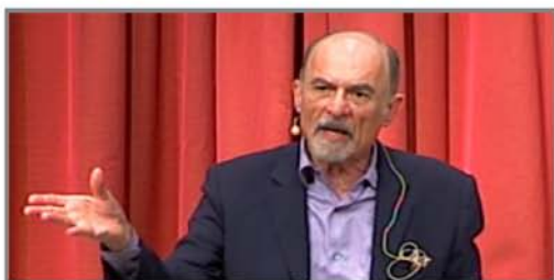
Irvin Yalom 2007