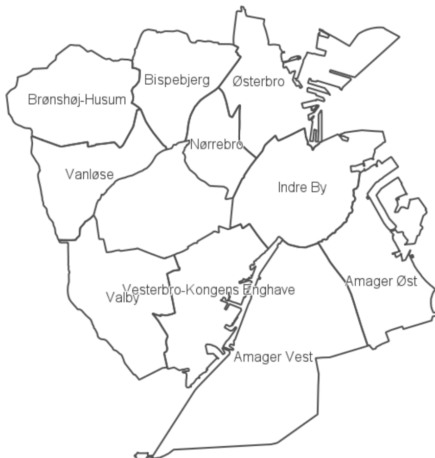
Figur 1: Københavns Kommunes bydele. Kilde: http://kbhkort.kk.dk/

Vær opmærksom på, at Amager Øst og Amager Vest fremstår som to bydele på københavnerkortet. Dette skyldes, at de er to administrative bydele, men Amager Øst og Amager Vest anses som en bydel. Amager er derfor også et samlet planlægningsområde.