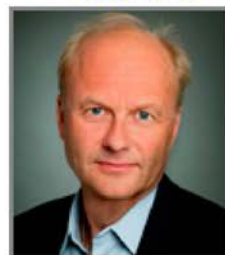
Finn Skårderud 2012