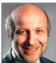
Peter Fonagy 2006