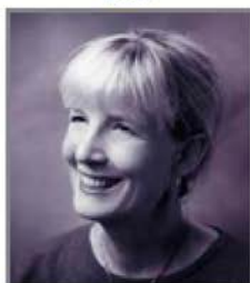
Nancy McWilliams 2009