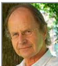
Sigmund Karterud 2011