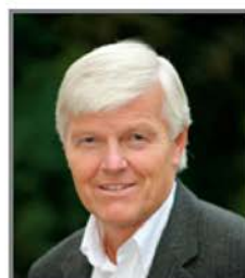
Atle Dyregrov 2011