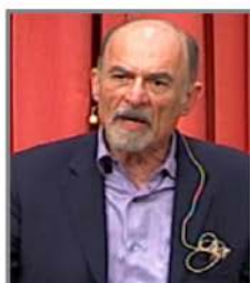
Irvin Yalom 2007