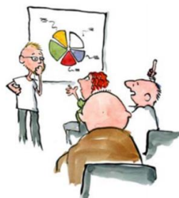
Illustrationer: Fritz Ahlefeldt